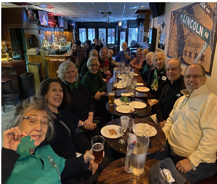
Senior Club Celebrating St. Patrick's Day at Ricochet's